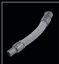
Rallonge flexible : pour aspirer dans les moindres recoins.