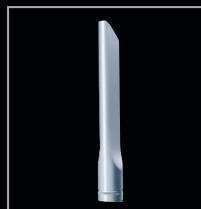
Le suceur long permet d'accéder aux espaces confinés de la maison.