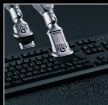
Le conduit pour débris se transforme en brosse à poussières pour les surfaces fragiles.