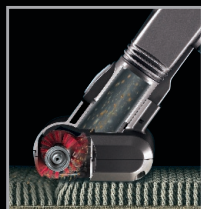
Brosse motorisée : pour aspirer en profondeur les poussières, fibres et poils d'animaux.